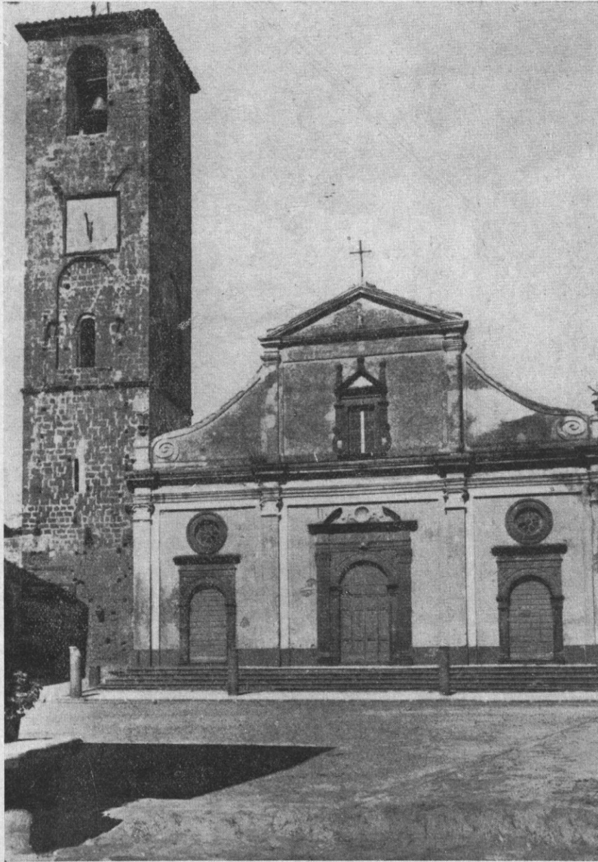
Fig. 1. - Chiesa parrocchiale di Civita, già cattedrale di Bagnoregio, nella quale quasi certamente fu battezzato S. Bonaventura: Prospetto principale.