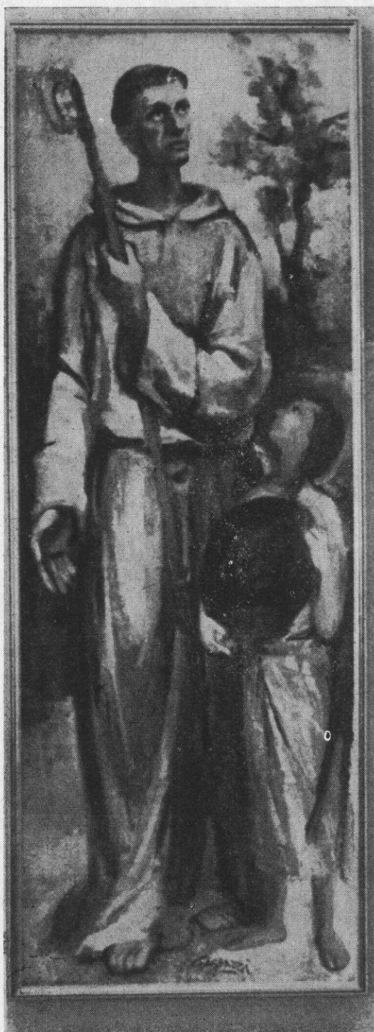
Fig. 1. - Mostra del II Premio di pittura « Città di Bagnoregio » (A. 1962).