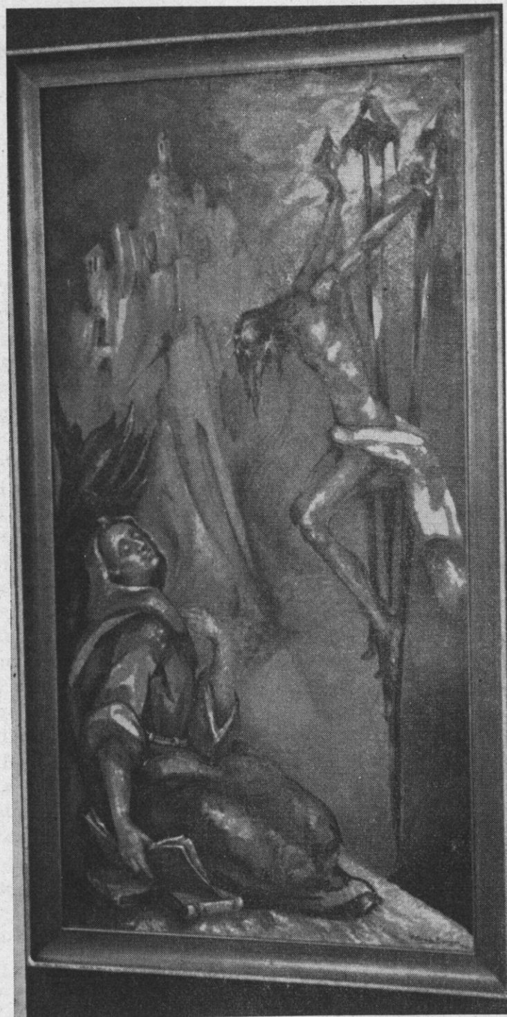
FIG. 1. - Mostra del II Premio di Pittura « Città di Bagnoregio » Palma Burgos Francisco: ITINERARIUM MENTIS IN DEUM